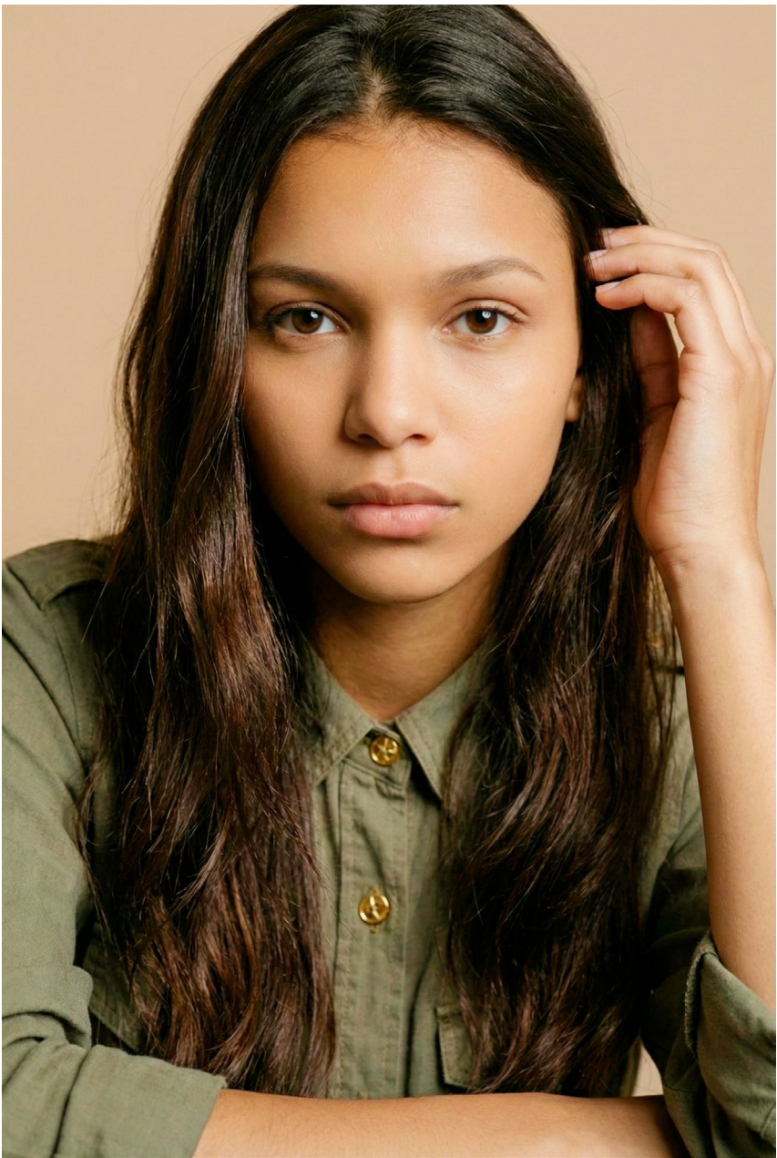
retrato cabeça/ombros olhar direto, neutro