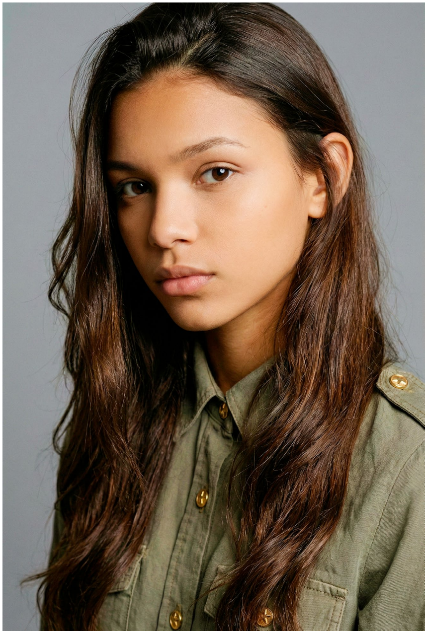
retrato cabeça/ombros perfil leve

As poses padrão têm a função de apresentar o modelo de forma clara, profissional e versátil, destacando proporções, expressões e postura. Nesta seção, você encontrará a estrutura básica de poses que compõem o padrão da plataforma, servindo como guia para conduzir a sessão de forma objetiva e consistente.