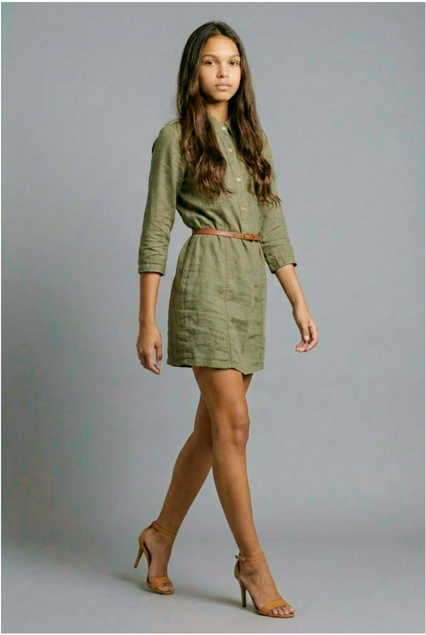
corpo inteiro em movimento