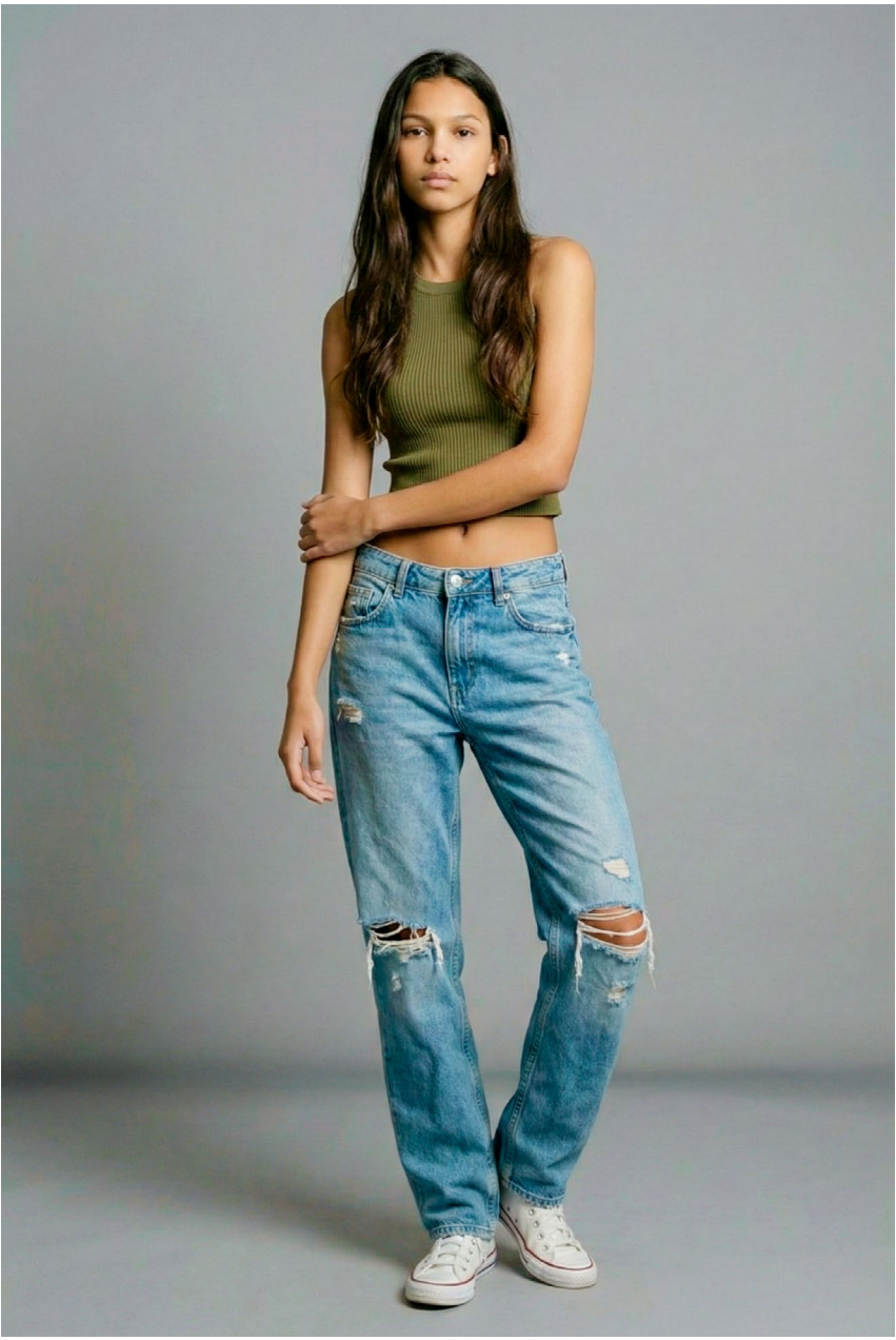
corpo inteiro frente