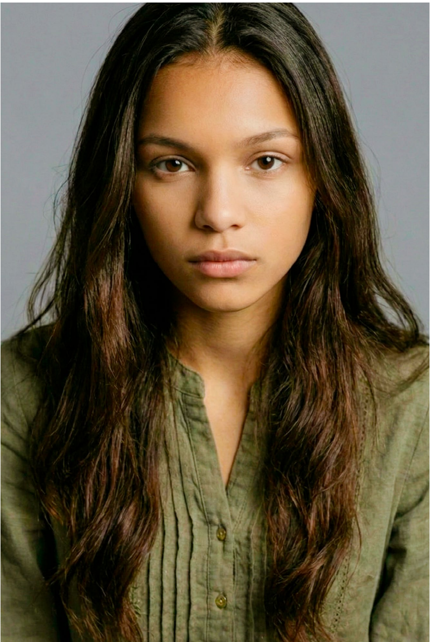
retrato cabeça/ombros olhar direto, neutro