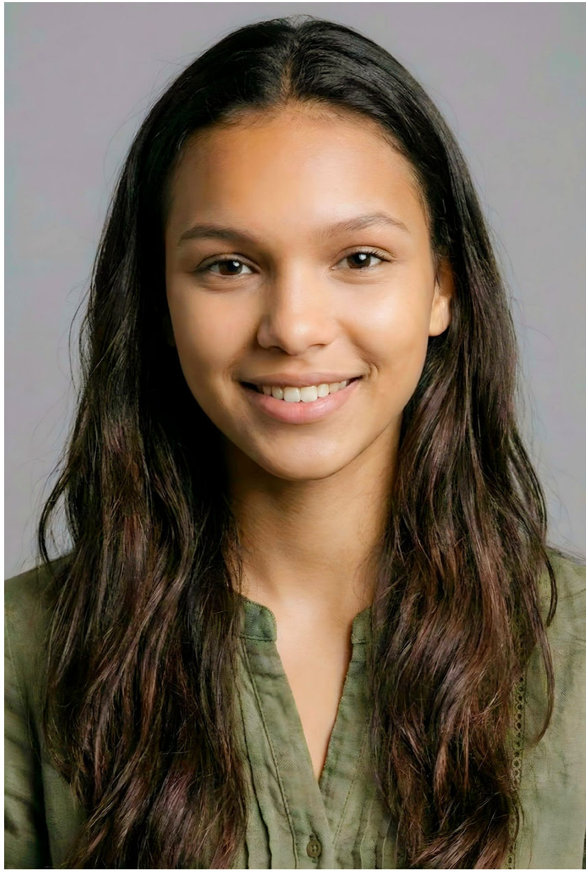
retrato cabeça/ombros leve sorriso, expressão suave